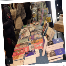
Nuit de la lecture, le 24/01/2025 - Femmes Engagées - à la médiathèque de Muret