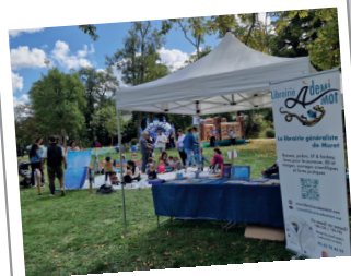
Stand Festitoup'tis, le 28 septembre 2024, avec Le théâtre des Préambules à Muret