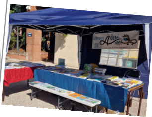
Stand Fête des AMAP, le 28 septembre 2024, avec Les AMAPs de Fontenilles