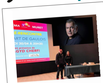
Rencontre avec Magyd Cherfi le 30 avril 2024, cinéma VEO de Muret