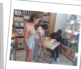
Dédicaces des élèves du collège Niel le 8 juin 2024

FERMETURE de la librairie pour CONGÉS d'ÉTÉ