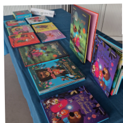
Lecture au Ciné-goûter (Vive le Cinéma/VEO) le 13 déc. 2023