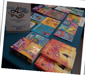
Stand spécial Roald Dahl au cinéma VEO le 19 déc. 2023